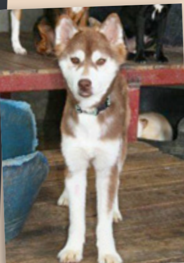
Kate heute >