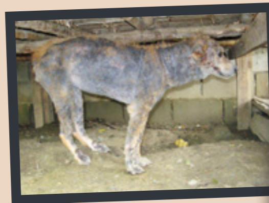
▲ So fanden wir Beauty