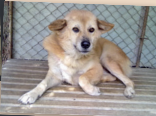
Beauty heute >