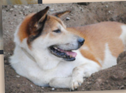
▲ Bo heute