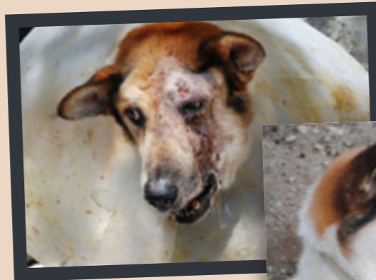
▲ Bo nach der ersten Verarztung